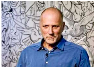
Motivational speaker & Entrepreneur