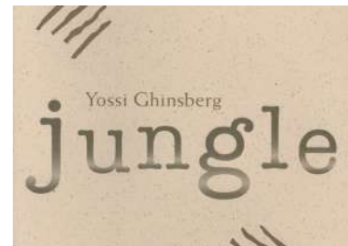
Author of the bestseller “Jungle: A Harrowing True Story of Survival”